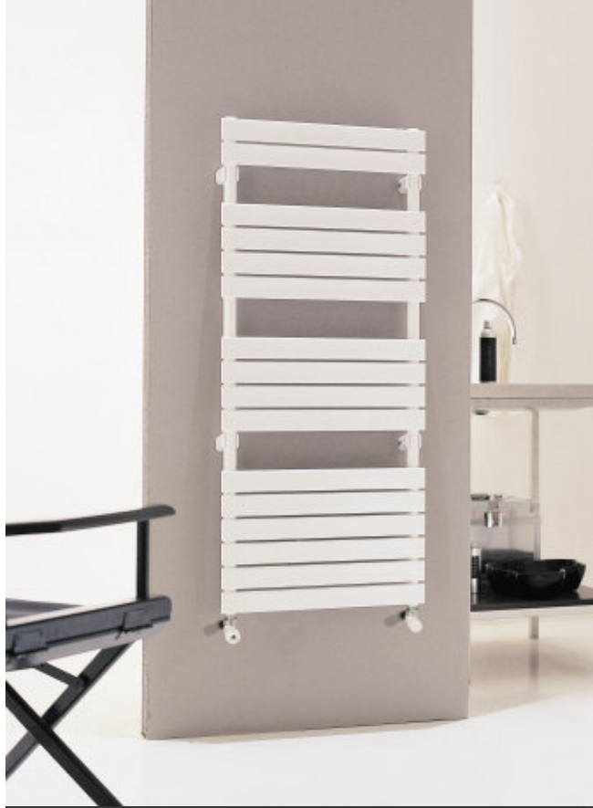
En foto: Radiadore Xilo. Altura mm 1152, anchura mm 556, color Blanco Estándar (cód. 01).