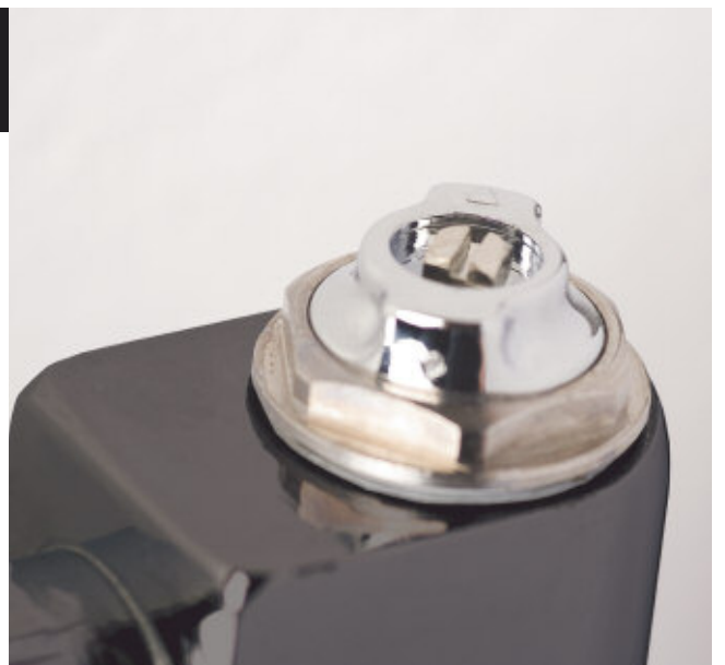
Válvulas radiadore Xilo.

Calor en el mínimo espacio. Estilizado, etéreo, ligero de forma. XILO es el paradigma del calor en el mínimo espacio gracias a su estructura tubular plana.