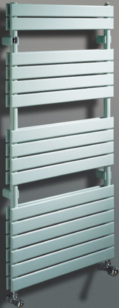
Mod. XILO 2, 1516 x 506 mm., color Verde Greenwich (cód. 28)