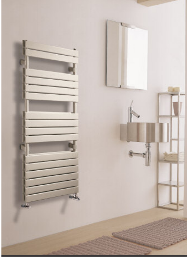
En foto: Radiadore Xilo 2. Altura mm 1152, anchura mm 606, color Beige Natura (cód. 38).