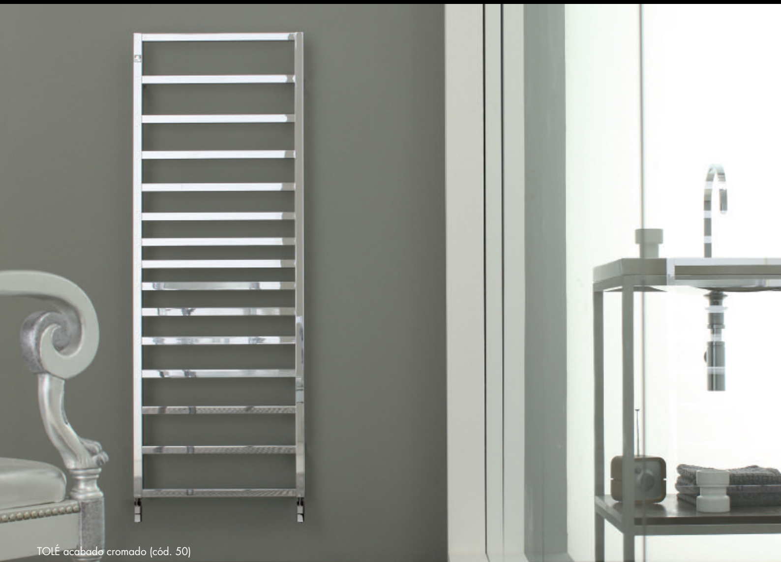
TOLÉ acabado cromado (cód. 50)