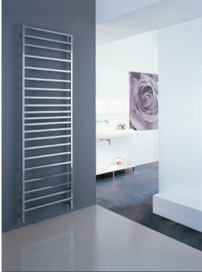
Tolé. Altura mm 1902, Anchura mm 481, Cromado (cod. 50).