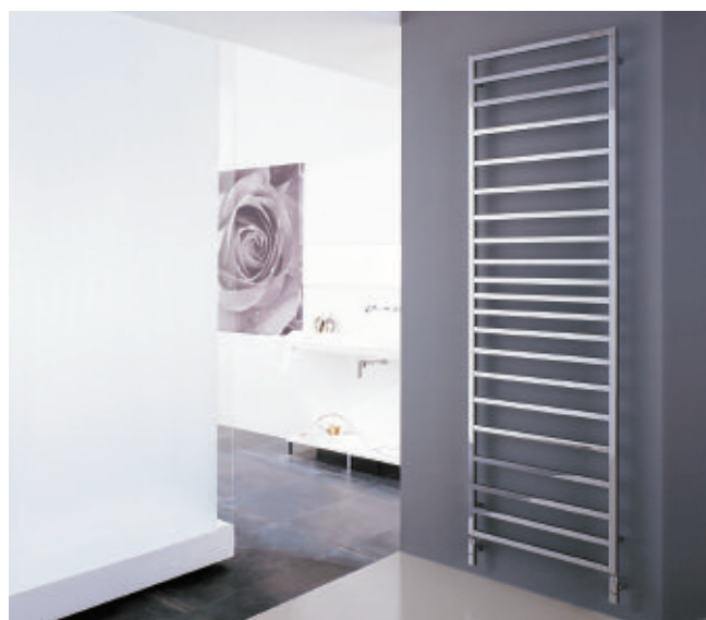
TOLÉ acabado cromado (cód. 50)

El corte incisivo y limpio de sus elementos radiantes cuadrados hace de Tolé un radiador de diseño creativo, potente y elaborado.