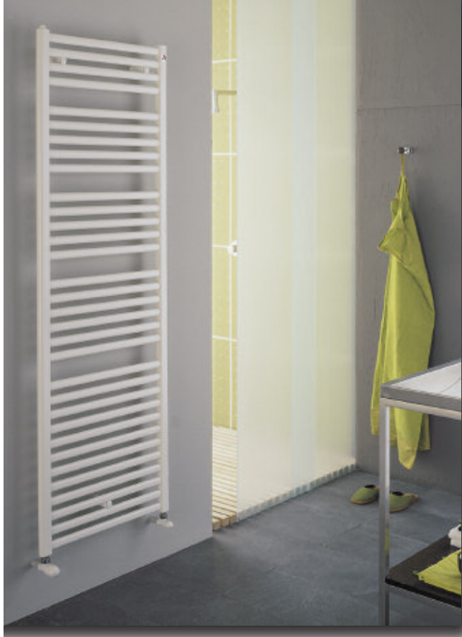
En foto: Radiadore Pareo. Altura mm 1800, anchura mm 600, color Blanco Estándar (cod. 01).