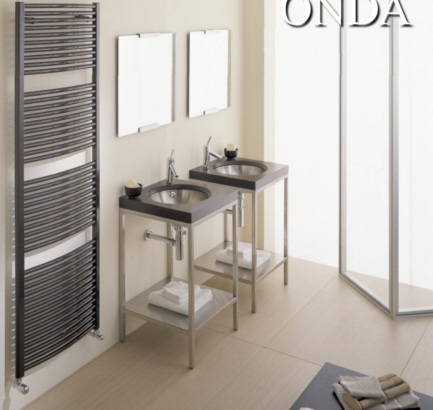
Mod. ONDA, 1808 x 586 mm., color Gris Cuarzo (cód. 31)