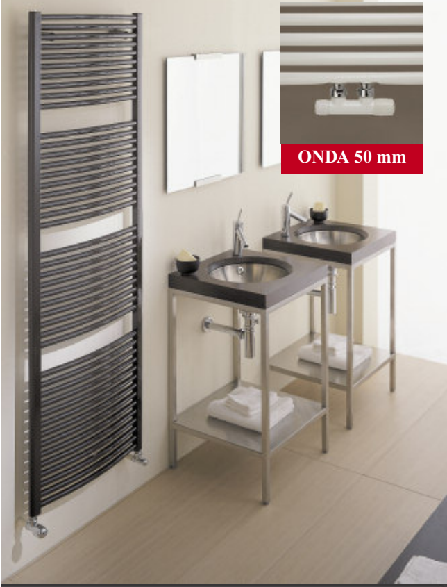
En foto: Radiadore Onda. Altura mm 1808, anchura mm 586, color Gris Cuarzo (cód. 31).