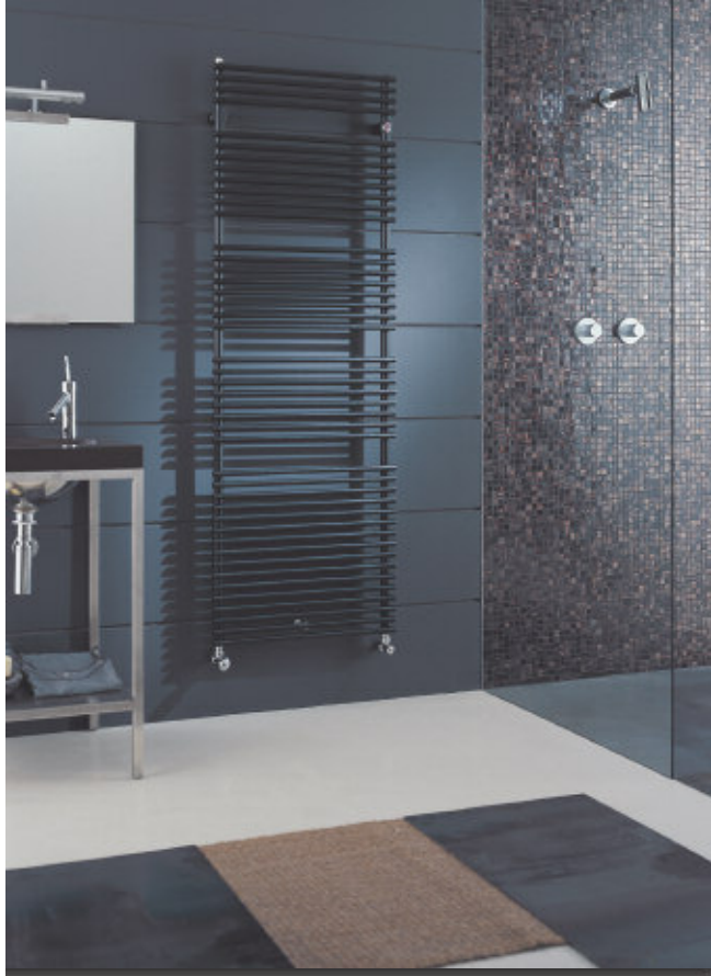
En foto: Radiadore Flauto. Altura mm 1762, anchura mm 606, color Negro Satinado (cod. 30).