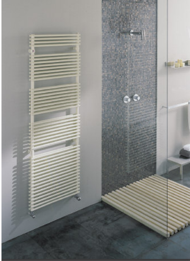
En foto: Radiadore Flauto 2. Altura mm 1762, anchura mm 606, color Marfil (cod. 02).