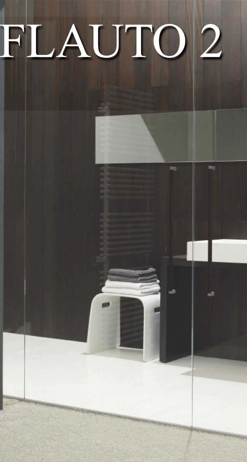
Mod. FLAUTO 2, 1762 x 556 mm., color Gris Aluminio (cód. B4)