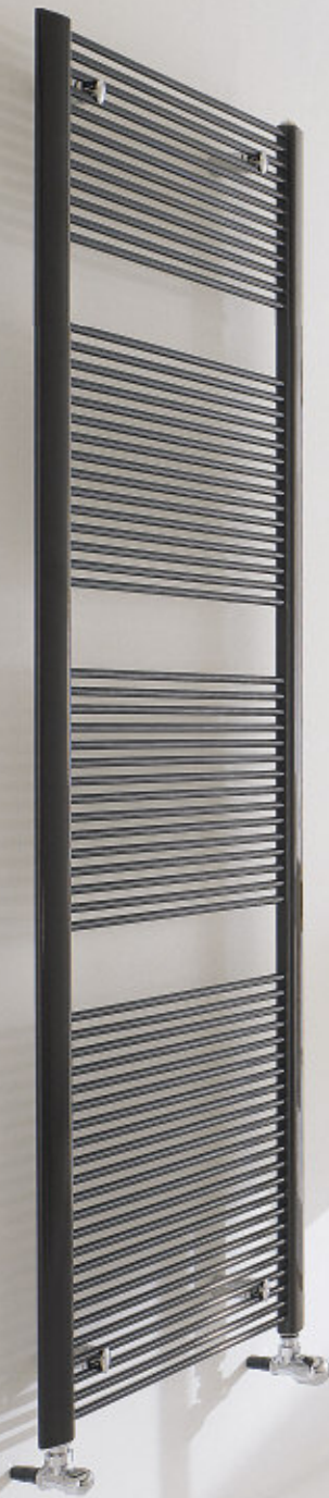
Mod. FILO, 1709 x 516 mm., color Marrón (cód. 09)