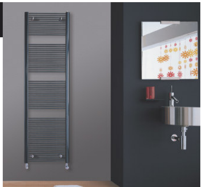
Mod. FILO, color Gris Cuarzo (cód. 31)

Esbelto y cautivador. De línea depurada, FILO combina a la perfección en cualquier ambiente, convirtiéndose en la alternativa sorprendente a las soluciones tradicionales.