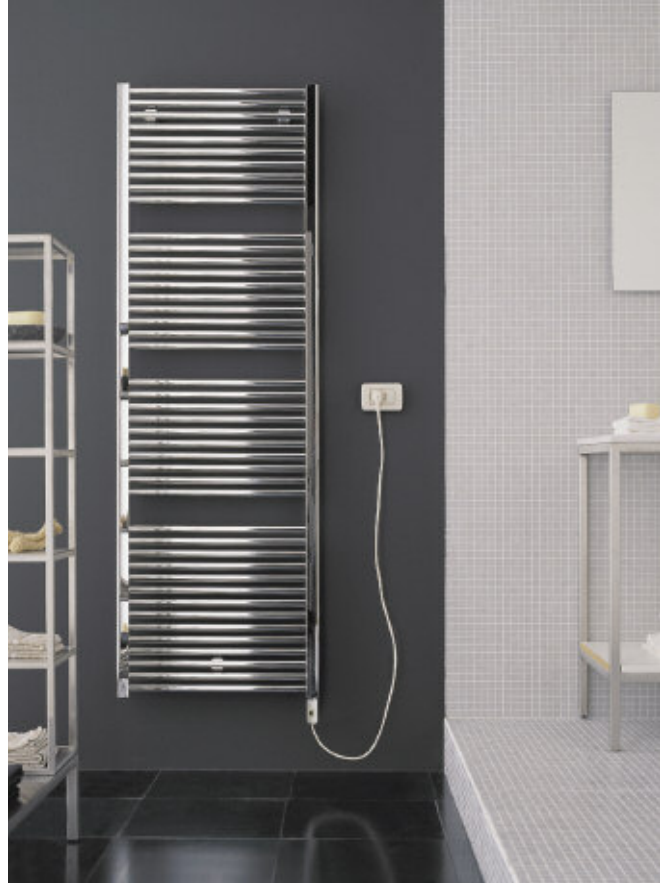
En foto: Radiadore Novo 23 Eléctrico. Altura mm 1808, anchura mm 750, acabado Cromado (cód. 50) - resistencia eléctrica con control electrónico wireless.